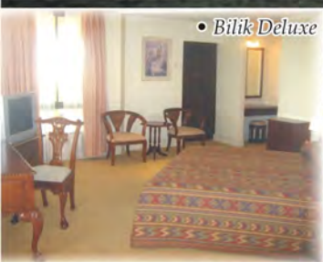
• Bilik Deluxe