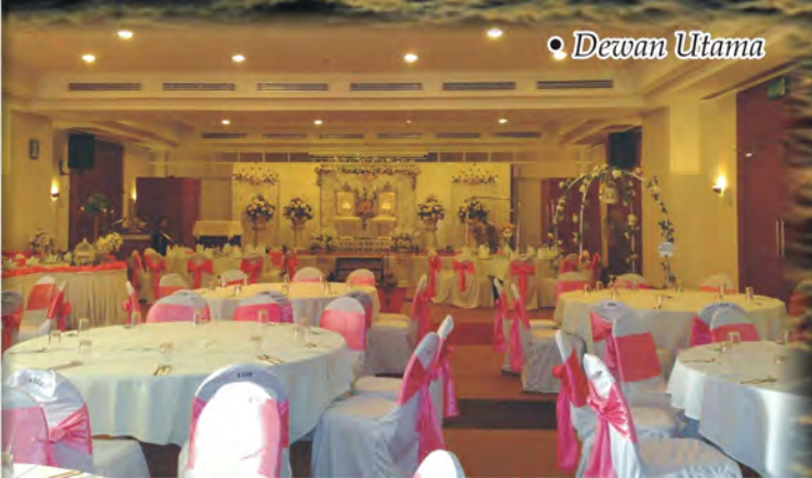
• Dewan Utama