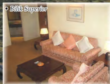
• Bilik Superior