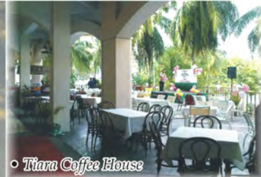
• Tiara Coffee House