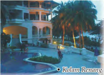
• Kolam Renang